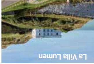
La Villa Lumen

Beau Site Lodge room: €139 - €349 for 1-2 guests Beau Site Lodge sits in the heart of the forest, 1.1 km from reception and just a stone's throw from the sea. This peaceful location in Le Bois de