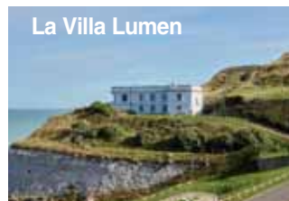
La Villa Lumen