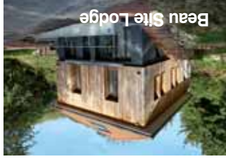
Beau Site Lodge